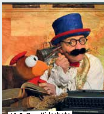
12.8. Don Kidschote