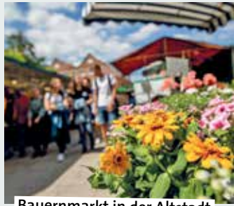
Bauernmarkt in der Altstadt

ches vom Hof. Aus der Region für die Region. Marktplatz Lüdinghausen