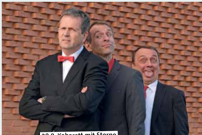
20.8. Kabarett mit Storno

warten nicht nur auf den schnellsten Fahrer, sondern auch auf die ausgefallenste Seifenkiste. Darüber hinaus wird natürlich im Rosengarten gefeiert. Veranstalter: Heimatverein Seppenrade