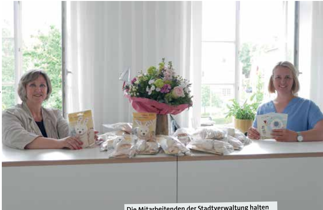
Die Mitarbeitenden der Stadtverwaltung halten so einige Präsente für Neubürger bereit.