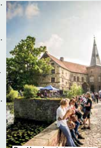
Der Abendmarkt im Burghof

10.00 bis 15.00 Ritterlager für Kids. Über zwei Tage erstreckt sich das Ritterlager für Kinder auf der Kapellenwiese von Burg Vischering. Hier ist Zeit für Abenteuer, Ritterspiele, Bastelaktionen und vor allem viel Spaß am Ausprobieren und Entdecken. Dabei tauchen die Kinder ganz tief in die Zeit des Mittelalters ein und erfahren täglich etwas mehr über das Leben auf einer Ritterburg. Mittags gibt es natürlich einen zünftigen Schmaus, damit die Puste für den Nachmittag nicht ausgeht. Für Kinder von 8 bis 11 Jahren (max. 25). Kosten: 70 Euro pro Kind, inkl. Mittagessen und Getränke; Burg Vischering (Wiese