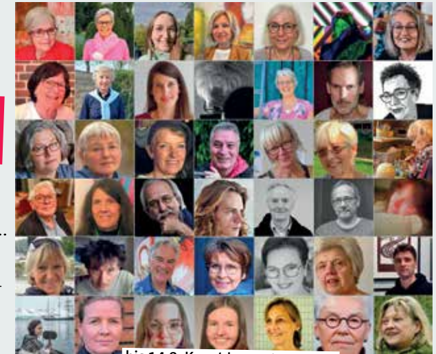
bis 14.8. Kunst kommt von uns.

8.00 bis 13.00 – Wochenmarkt. Marktplatz