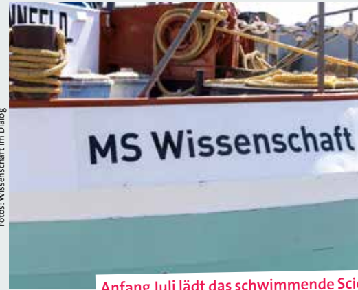
Anfang Juli lädt das schwimmende Science Center zum Besuch ein.