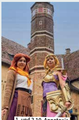
1. und 2.10. Annotopia