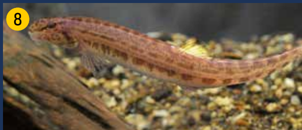
Steinbeißer sind 8 bis 10 cm große Fische, die am Grund naturnaher Fließgewässer leben. Zur Nahrungssuche benötigen sie „frisch“ von der Strömung umgelagerte Sande. Steinbeißer sind nacht- und dämmerungsaktive Fische. Sie ernähren sich, indem sie Sand „durchkauen“, Kleintiere und organisches Material daraus aufnehmen und den restlichen Sand durch die Kiemen wieder ausstoßen. Die wenigen Restvorkommen sind in NRW über die FFH-Richtlinie geschützt.