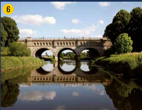
Historische Dreibogenbrücke – Inbetriebnahme 1899 – des ehemaligen Kanals über die Stever mit Blick auf den östlichen Teil des Beweidungsprojektes Steveraue.