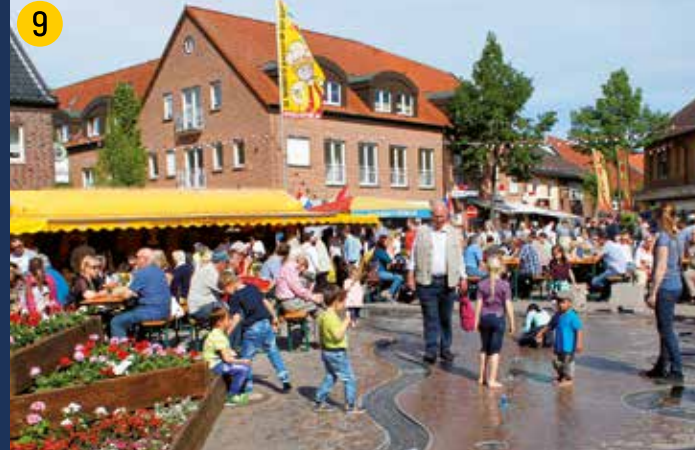
Ofen – der bunte Markt lädt ein zur Rast und einem Eis.

Der Radweg folgt mit dem Kleeblatt-Logo dem ausgeschilderten Wegenetz (rote Schrift, roter Pfeil, rotes Rad). Wo das offizielle Wegenetz verlassen wird, übernehmen die sechseckigen Schilder mit blauem Pfeil und blauem Rad die Wegweisung. Den GPS-Track finden Sie auf den Internetseiten der verschiedenen Partner des Projektes.