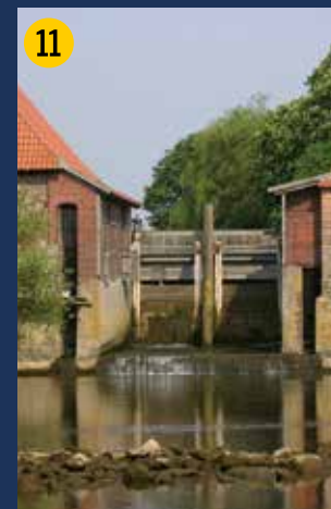
Die Füchtelner Mühle – malerisch und im Nebenfluss als kleines Wasserkraft-Werk genutzt. Durch den Bau einer Umflut ist hier 2015 die Durchgängigkeit der Stever für wandernde Fische wieder hergestellt worden.