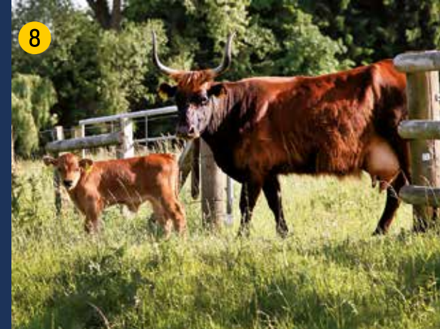
Heckrinder sind auerochsenähnliche Rinder, die zusammen mit robusten Konik-Pferden eine naturnahe, artenreiche Weidlandschaft entstehen lassen.

Flußneunaugen gehören zu den sogenannten Rundmäulern, sind also keine „echten“ Fische. Die erwachsenen Tiere (bis zu 50 cm lang) leben als „Außenparasiten“ im Meer, z.B. an Hering oder Dorsch.