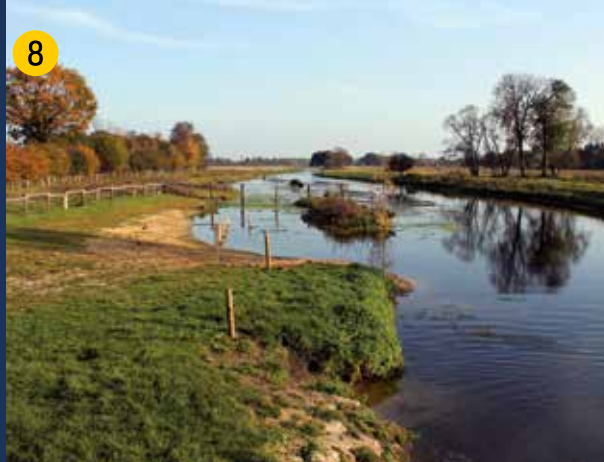
Blick in die „entfesselte“ Stever , deren Ufer nicht mehr technisch eingefasst werden (östlich der Füchtelner Mühle).