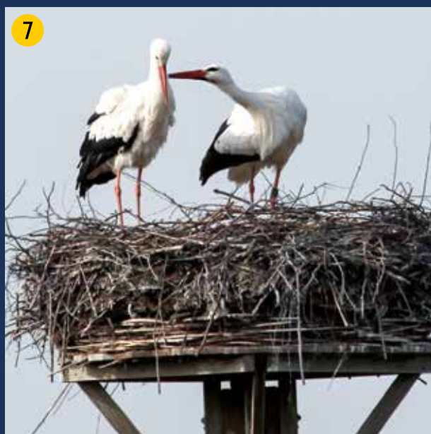
Erfolgreiche Storchbrut im Jahr 2013 – das Olfener Beweidungsprojekt ist Ursache für die Rückkehr des Weißstorks auch in unsere Region.