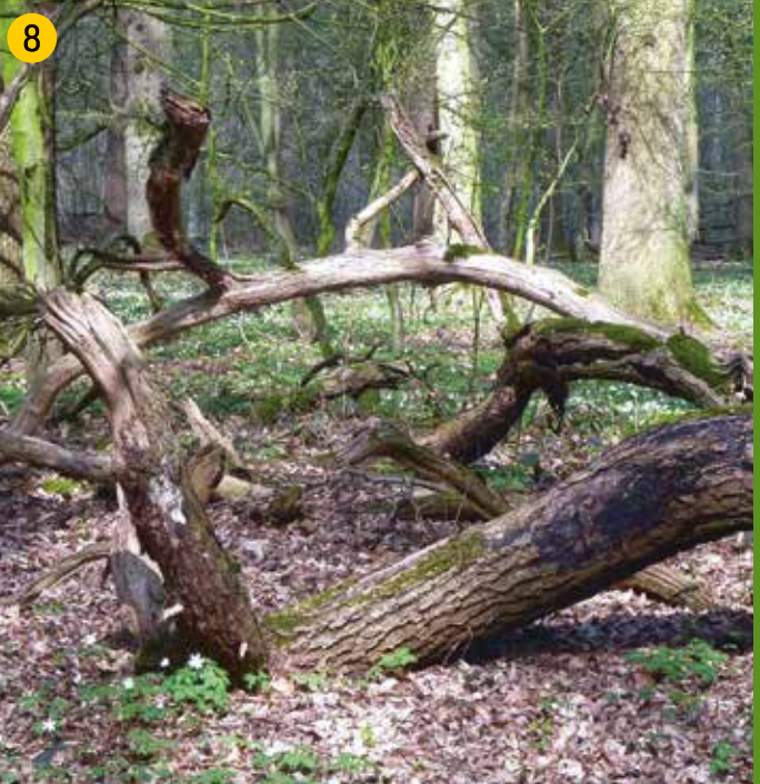
8 Natürlicher Alt- und Totholzreichtum ist charakteristisch für forstlich nicht genutzte Wälder. Damit kehrt der Artenreichtum zurück, der dem Wirtschaftswald fehlt.