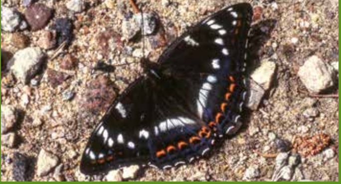
Kleiner Eisvogel – ein wunderschöner Falter der feuchten Laubwälder. Seine Rau-pen leben am Geißblatt.