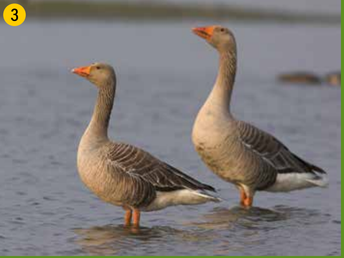
3 Graugänse brüten an den Gräben der Burg Vischering. In unserer Gegend ursprünglich für jagdliche Zwecke ausgewildert, haben sie sich weit verbreitet. Sie sind die Stammform der Hausgans.