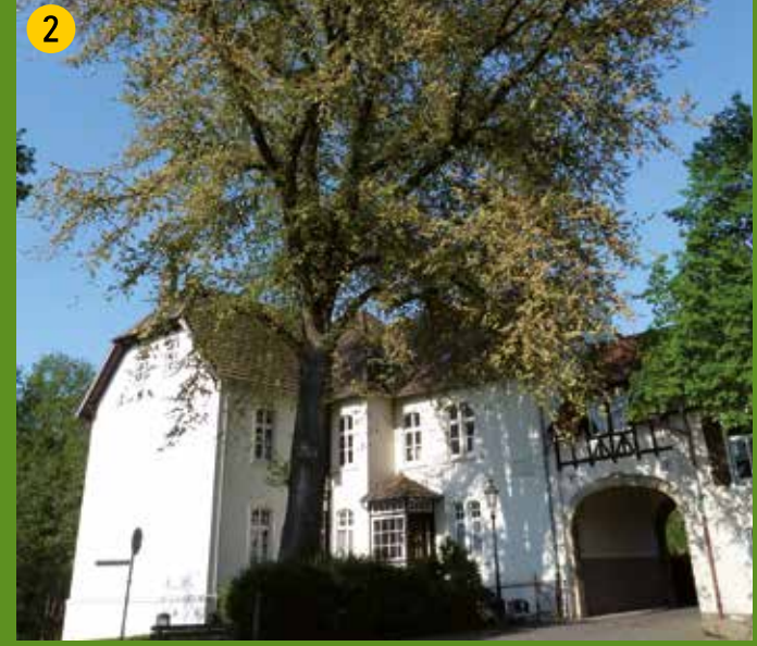
2 Die stattliche Ulme am Torhaus zur Renaissanceburg Lüdinghausen.

Den GPS-Track finden Sie auf den Internetseiten der verschiedenen Partner des Projektes.