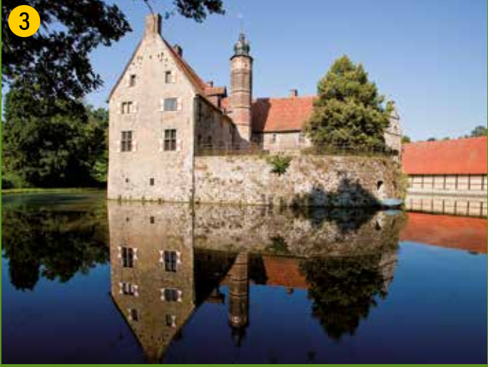
3 Burg Vischering – eine der schönsten Wasserburgen Deutschlands. Erstmals 1271 erwähnte Ringmantelburg mit Vorburg und weitläufigem Gräftensystem. Heute Münsterlandmuseum, mit wechselnden Ausstellungen in der Remise und Café in der Vorburg.