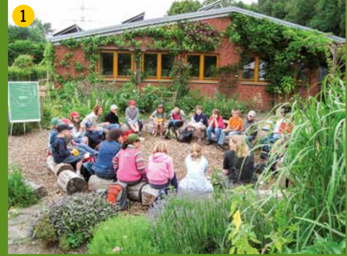
1 Biologisches Zentrum Kreis Coesfeld steht seit 30 Jahren für Umweltbildung in der Region. Besucher sind herzlich eingeladen! Genießen Sie das Gelände – www.biologisches-zentrum.de .