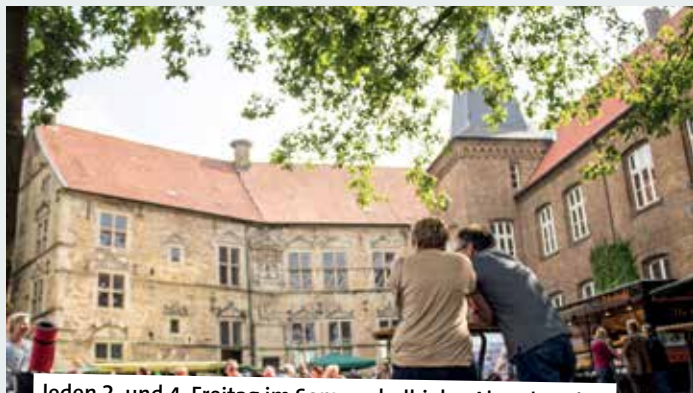
Jeden 2. und 4. Freitag im Sommerhalbjahr: Abendmarkt

8.00 bis 12.30 – Wochenmarkt. 14.00 bis 16.00 – Aktionstag: Unterwasser-Scooter. Klutenseeabad