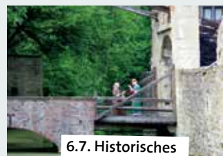
6.7. Historisches Mittelalterlager

16.00 – Abendmarkt. Innenhof Burg Lüdinghausen