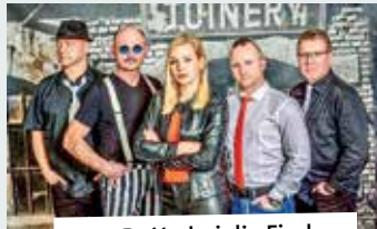
24.7. Butta bei die Fische

Wasserlaufball. Heute halten wir den Ball im Spiel – in einer riesigen Luftkugel auf dem Wasser laufen. Veranstalter und Ort: Klutensee-Bad.