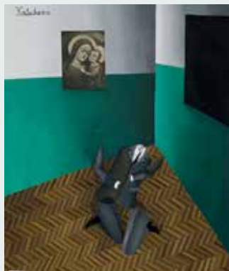
bis 3.11. Mateusz Szczypinski