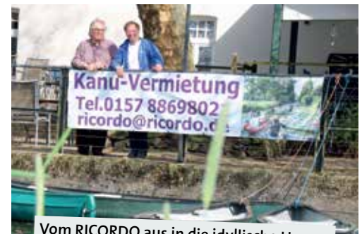
Vom RICORDO aus in die idyllische Umgebung – die Saison kann beginnen.