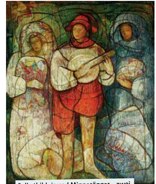
Selbstbildnis und Minnesänger – zwei Werke des Lüdinghauser Künstlers.