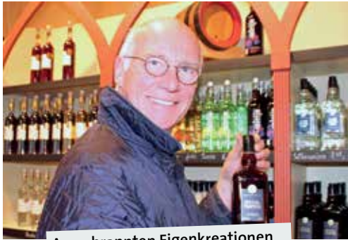
An gebrannten Eigenkreationen hat sich einiges angesammelt.