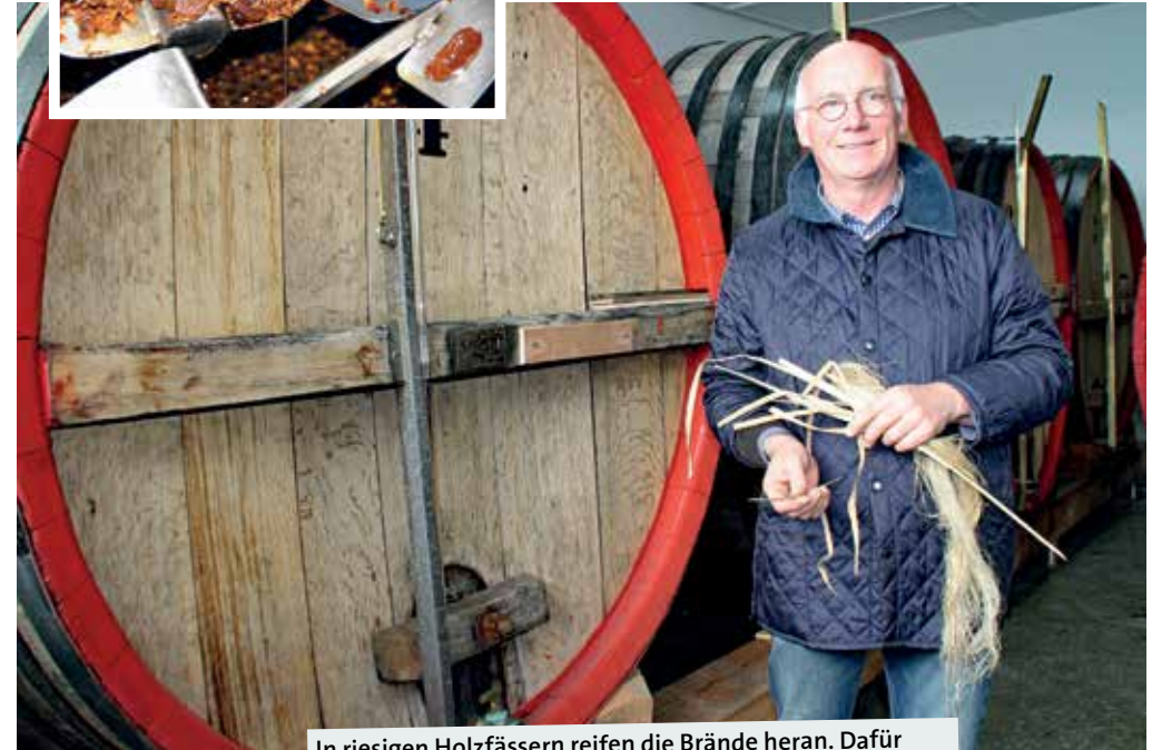
In riesigen Holzfässern reifen die Brände heran. Dafür braucht der Korn bis zu drei Jahre – Qualität braucht Zeit.