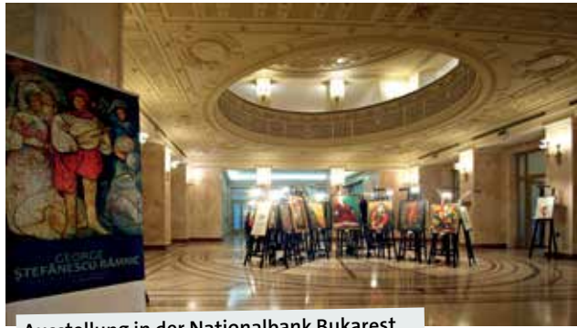
Ausstellung in der Nationalbank Bukarest.