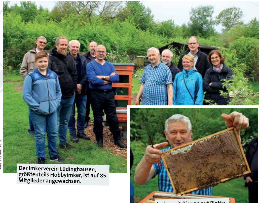
Der Imkerverein Lüdinghausen, größtenteils Hobbyimker, ist auf 85 Mitglieder angewachsen.

Bienen fliegen immer auf dieselben Blüten – solange der Vorrat reicht.