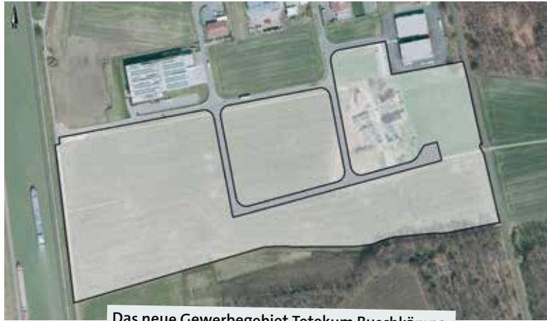
Das neue Gewerbegebiet Tetekum Buschkämpe