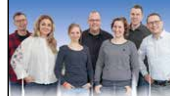
IHR RADIO KIEPENKERL-TEAM

NACHRICHTEN FÜR DEN KREIS COESFELD UND DAS MÜNSTERLAND (6.30 - 19.30 Uhr)