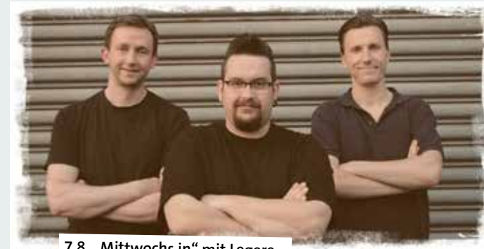
7.8. „Mittwochs in“ mit Legere

15.00 – Kostenlose Burgführung. Burgfreunde, Burg Lüdinghausen