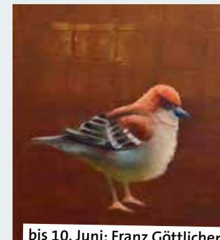
bis 10. Juni: Franz Göttlicher

13.00 bis 17.00 Offener Sonntag-nachmittag. Jeweils am 1. und 3. Sonntag im Monat von Mai bis September ist der Garten des Biologischen Zentrums zusätzlich zu den normalen Öffnungszeiten für Besucher geöffnet. Rohrkamp 29