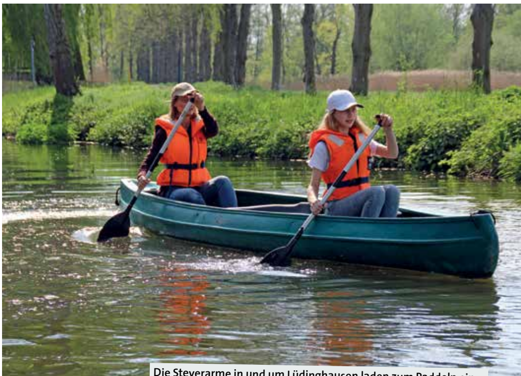
Die Steverarme in und um Lüdinghausen laden zum Paddeln ein.